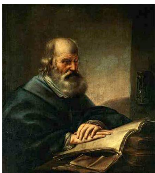
Философ с книгой. Художник Карел де Моор. Конец XVII — первая половина XVIII вв.

4. Контекстное чтение, или прочтение — предельная для исследователя стратегия чтения, в рамках которой читатель свободно переходит от одной стратегии чтения к другой, потому что прекрасно представляет себе контекст читаемого текста. Характерно для авторов, многие годы серьезно вчитывающихся в исследования по своей проблематике. Возможно в ускоренном формате с опущением ряда деталей как аналитическое чтение .