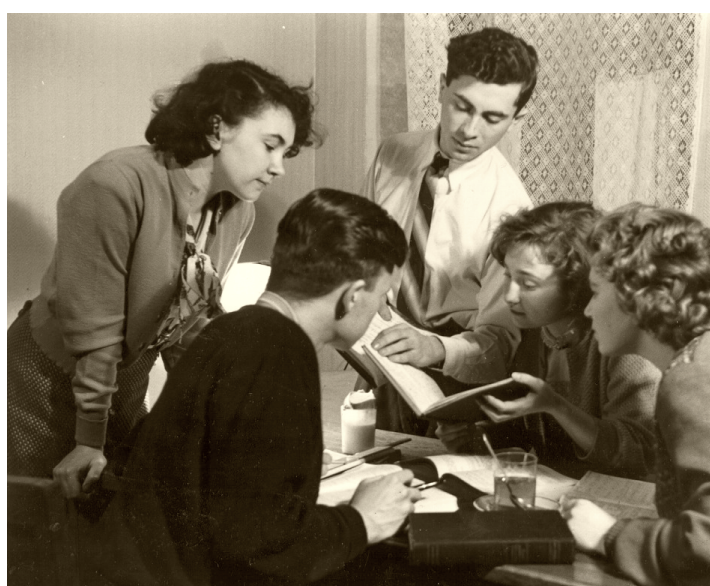
В научной библиотеке МГУ имени М.В. Ломоносова. Фото второй половины XX в. с сайта http://letopis.msu.ru/content/nauchnaya-biblioteka-moskovskogo-universiteta-student-chitayushchiy